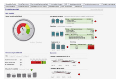
QlikView basiertes Produktionscockpit

Im Rahmen des aktiven Vertriebs von QlikView kooperieren die Aachener mit dem QlikView Master Reseller VAS Value Added Services GmbH (VAServ), der sich durch ein sehr partnerorientiertes Selbstverständnis auszeichnet: „Wir sehen uns als Dienstleister im Hintergrund, der den Resellern bei dem Ver-